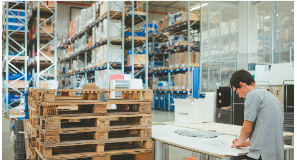
Blick ins WWM Logistikcenter