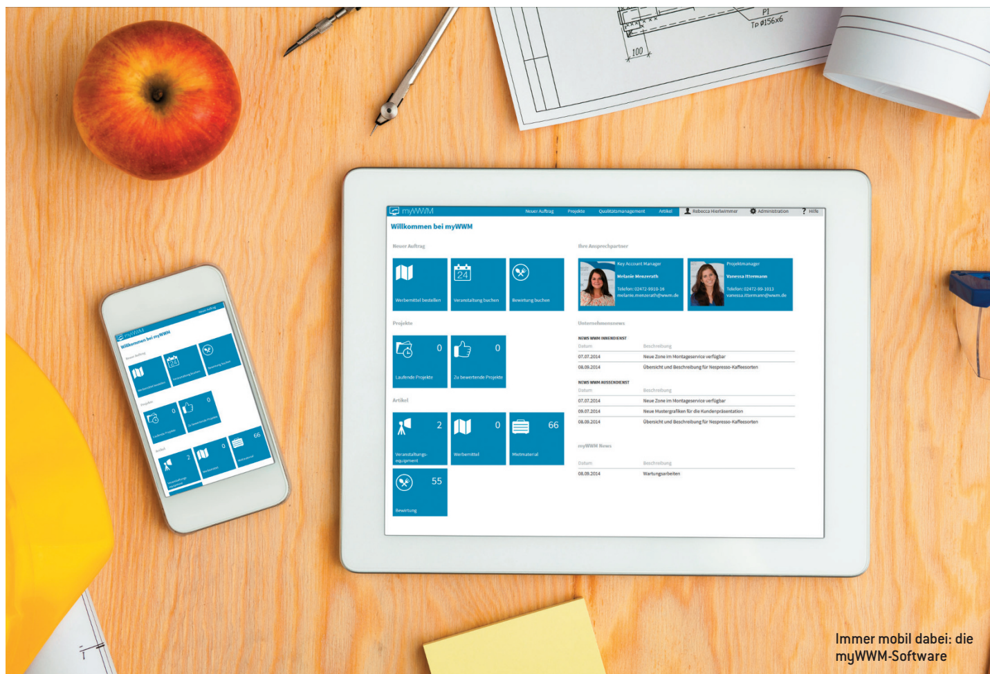
Immer mobil dabei: die myWWM-Software

Das Besondere an der WWMcloud ist, dass es nicht bei einem reinen Software-Tool bleibt: In die Cloud-Lösung sind Services inte-