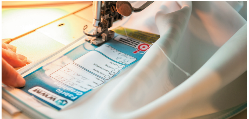
Finishing der Messegrafiken